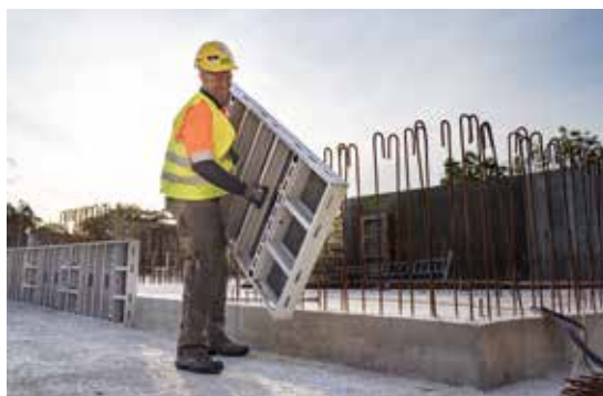
Når det skal gå hurtigt og nemt og uden kran, er DokaXlight den ideelle forskalling