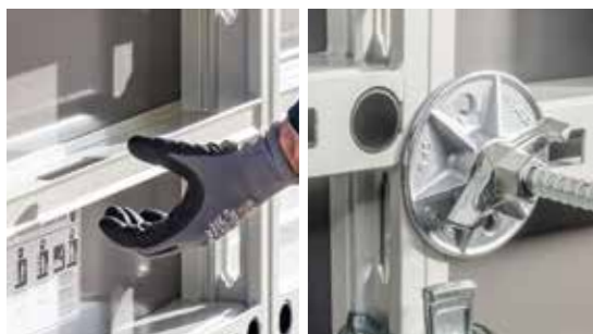
Let at håndtere med de integrerede håndtag og mange ganges genbrug på grund af Xlife finér med lang holdbarhed og ankerhulsbeskyttelse