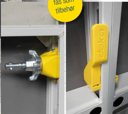
DokaXlight I- element-lås