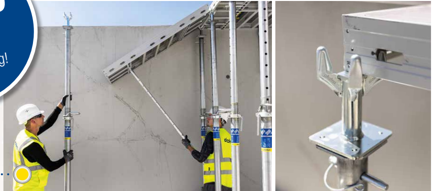
DokaXlight under opsætning