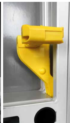
DokaXlight-stik i parkeringsposition