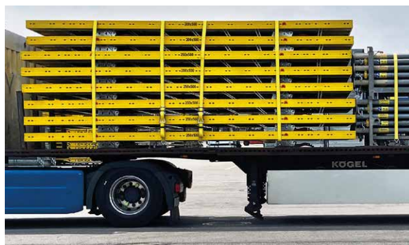
Stark reduzierte Transportkosten durch geringe Bauhöhe bis zu 520 m 2 /LKW