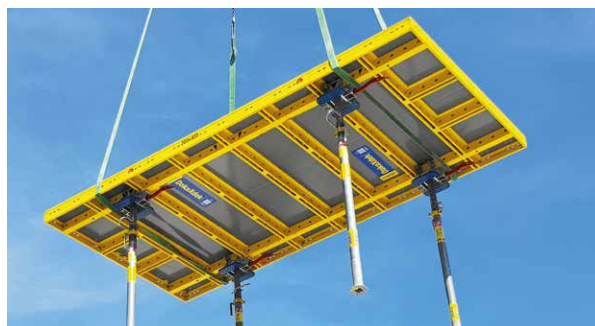
Schneller Einsatz durch vormontierte Schwenkköpfe