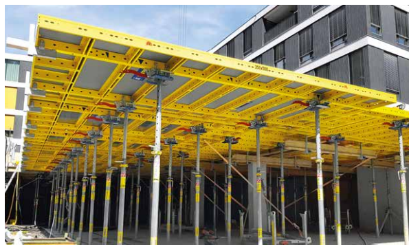
DokaXdek-Tische für mittlere und große Baustellen